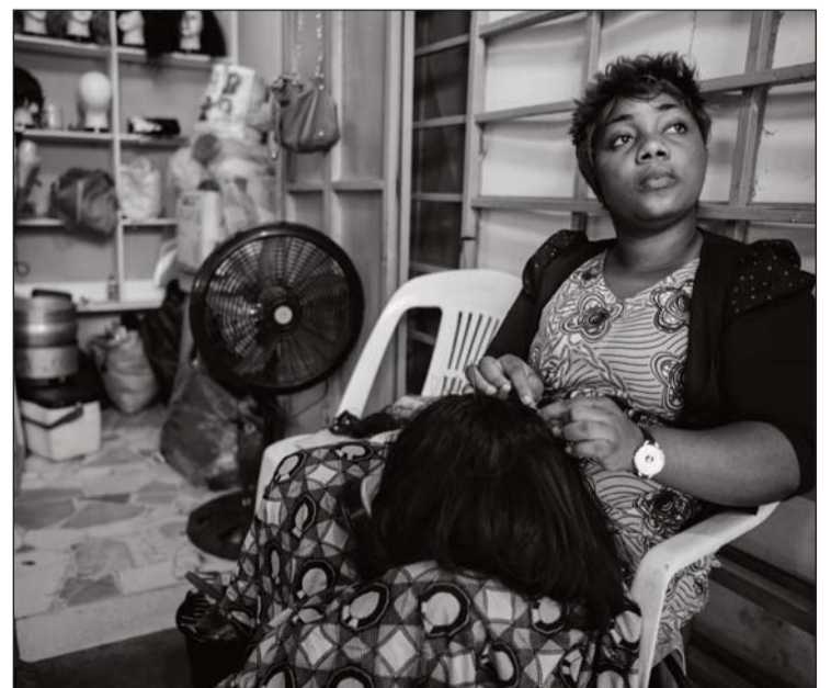
Imagen que forma parte de la exposición

Es un fotógrafo cuyo compromiso artístico y social se manifiesta en varios libros ( Dejados por muertos , Au bord du monde , Histoire de vivre , Face à elle , Homo artífex ), y es un artista cuyo talento se ha destacado, especialmente, cuando sus imágenes se centran en el retrato o el entorno natural y social.